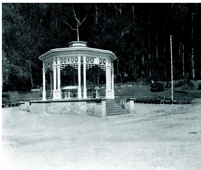
Quiosco de la Música, 1910

música y músicos de la generación del centenario