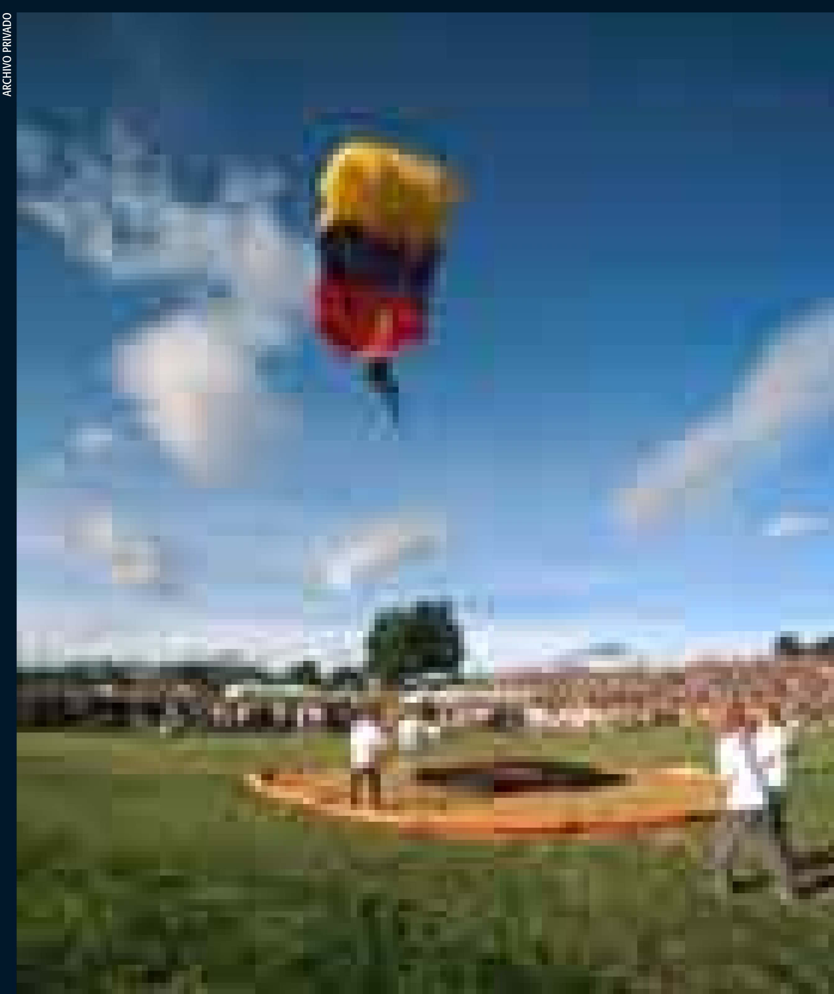
Actividades del Festival de Verano en el Parque Simón Bolívar.