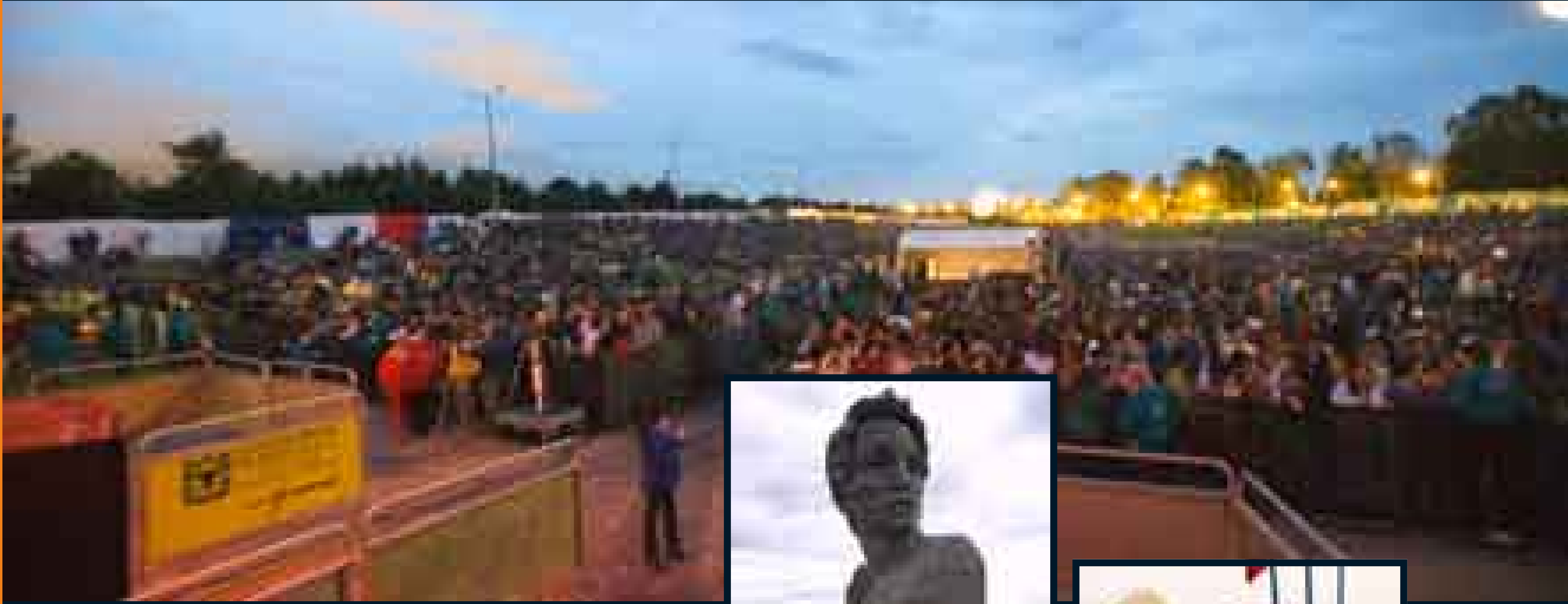
Concierto de Electrolux del festival de Música Francés en el Parque Metropolitano Simón Bolívar.