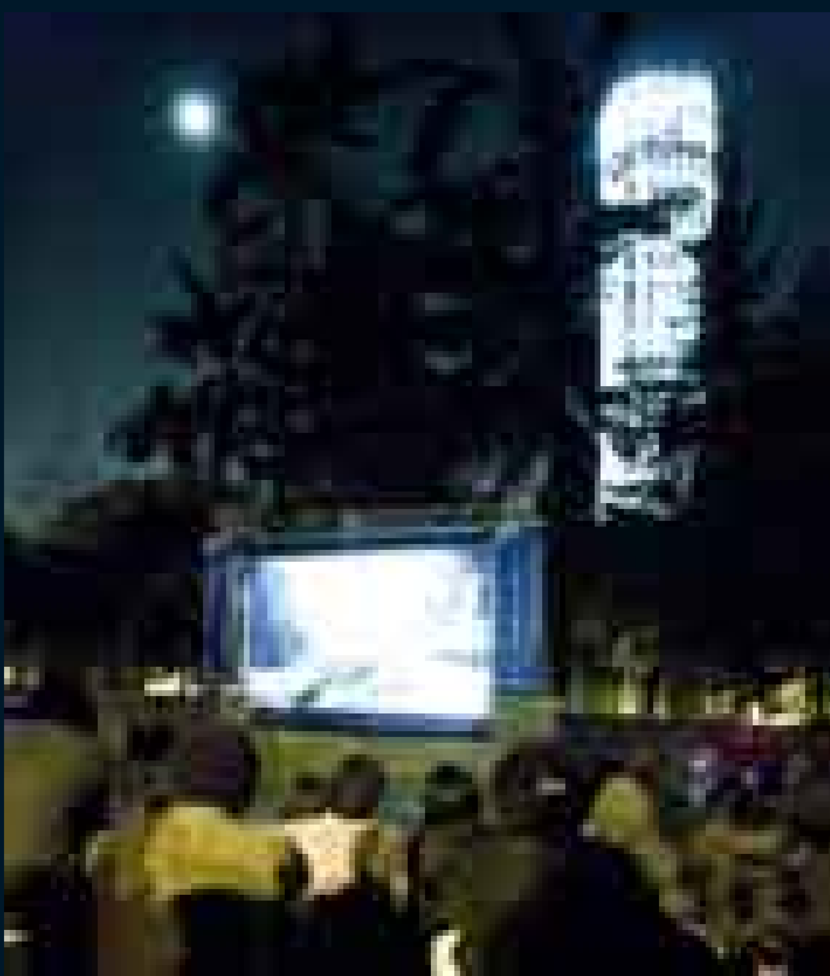
El Festival de Cine Francés en el Parque de La Independencia, en la carrera Séptima con calle 26.

Los parques se han convertido en importantes centros de actividades promotoras de la tolerancia, la salud, el respeto por la vida y la diversidad cultural y étnica.