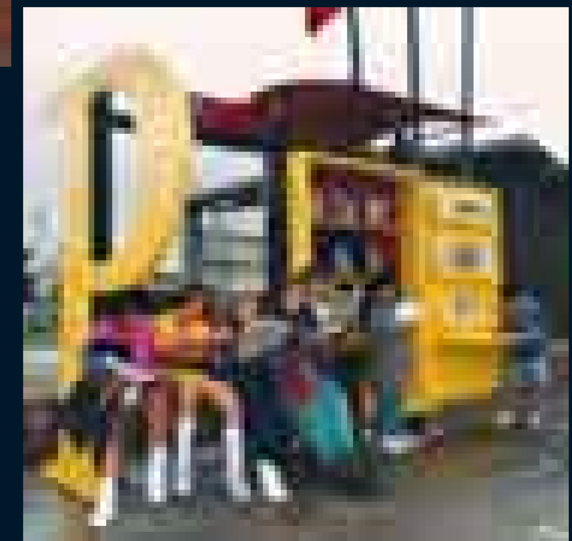
"Paraderos Para Libros Para Parques" en los distintos parques de la ciudad.