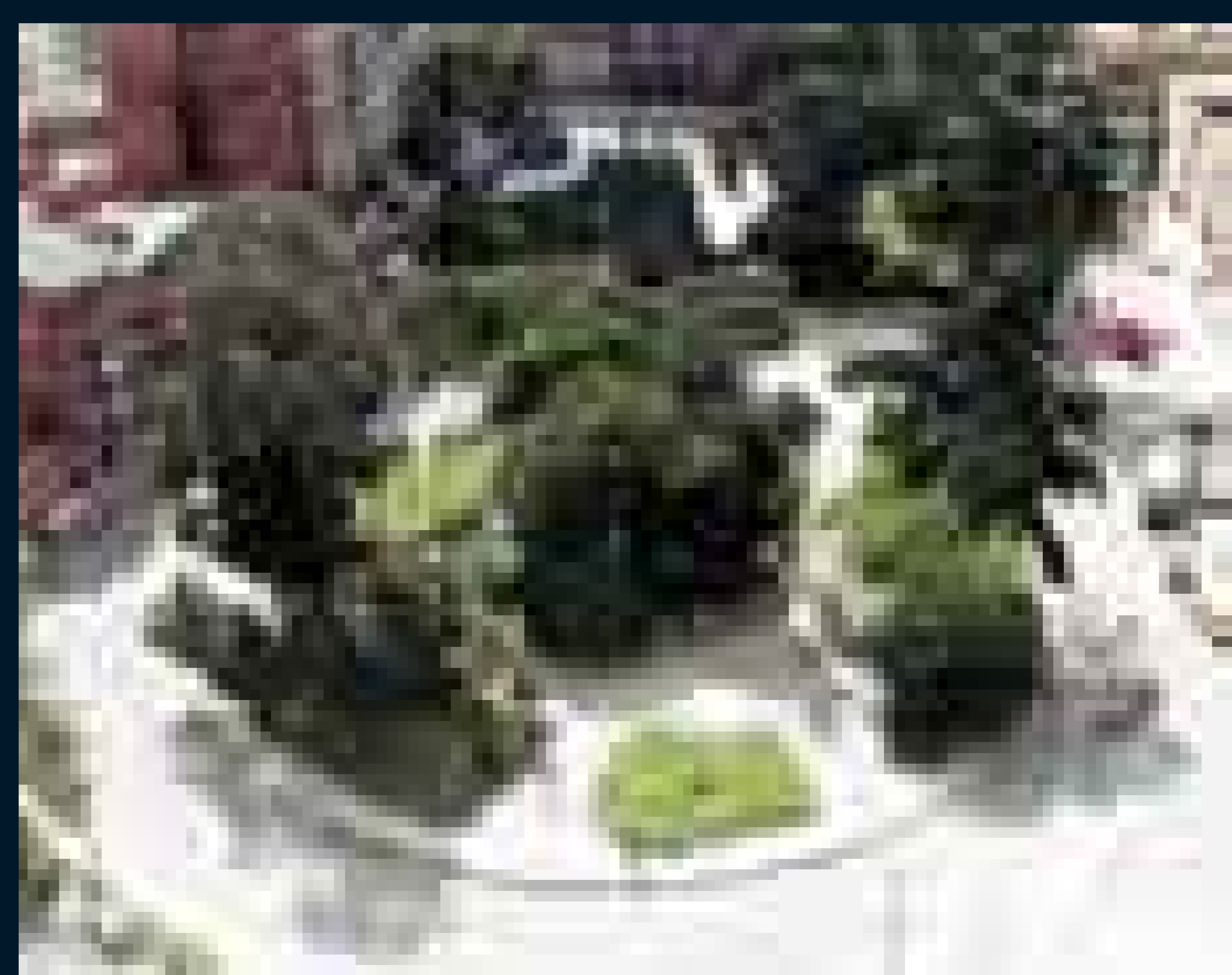
"Parque de los Hippies".