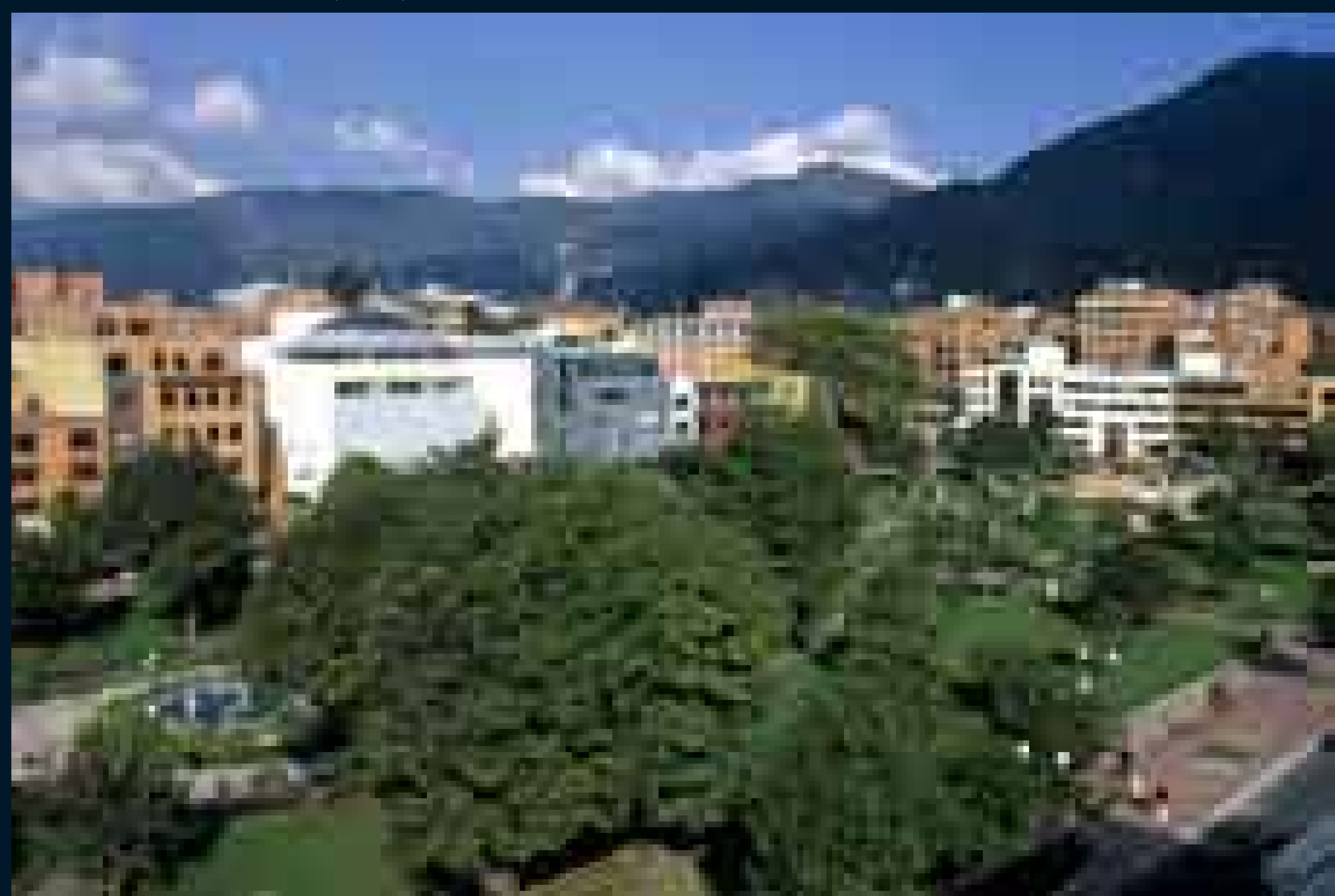
Parque de la 93.