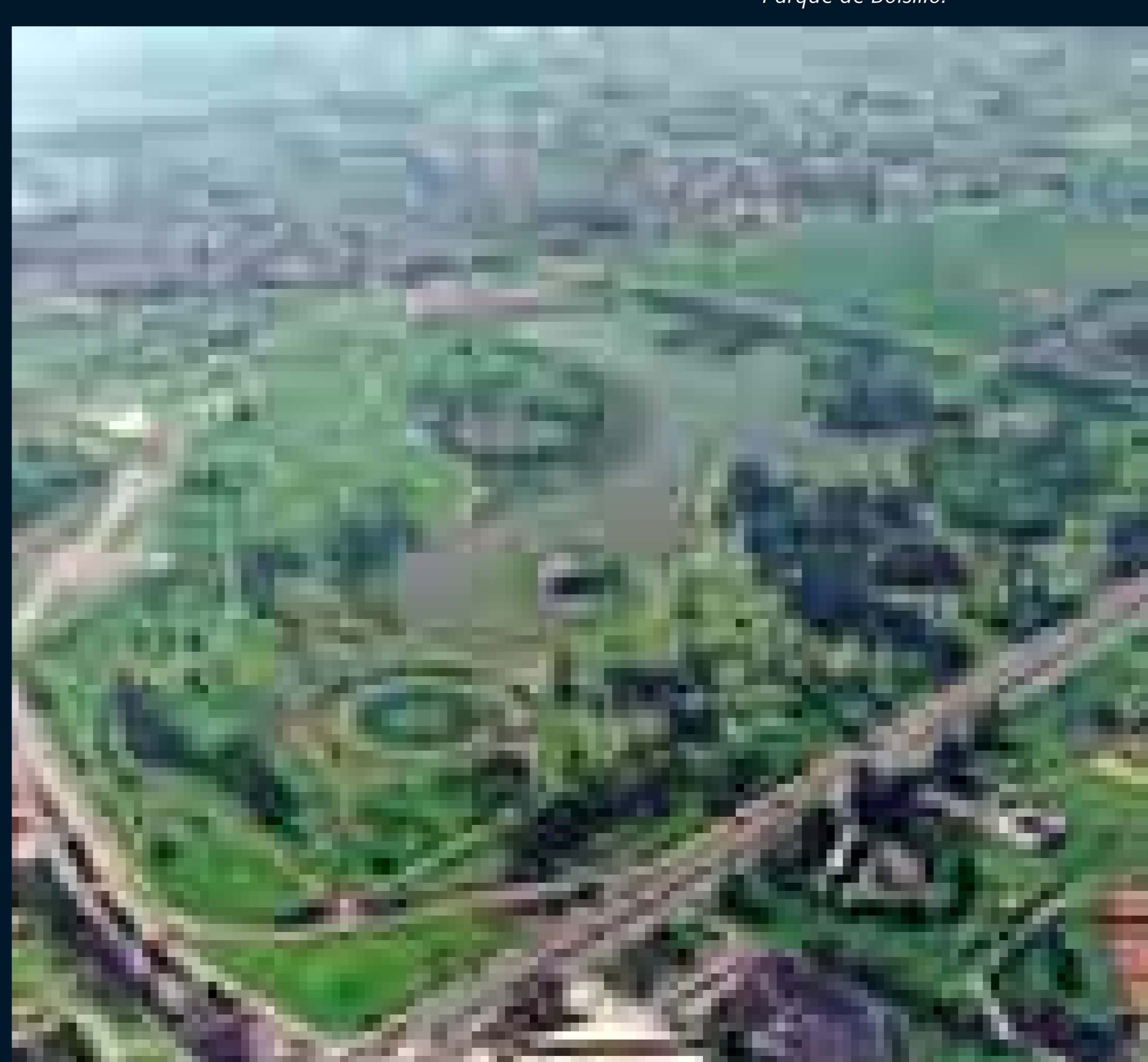
El parque Simón Bolívar es el más extenso de la ciudad.