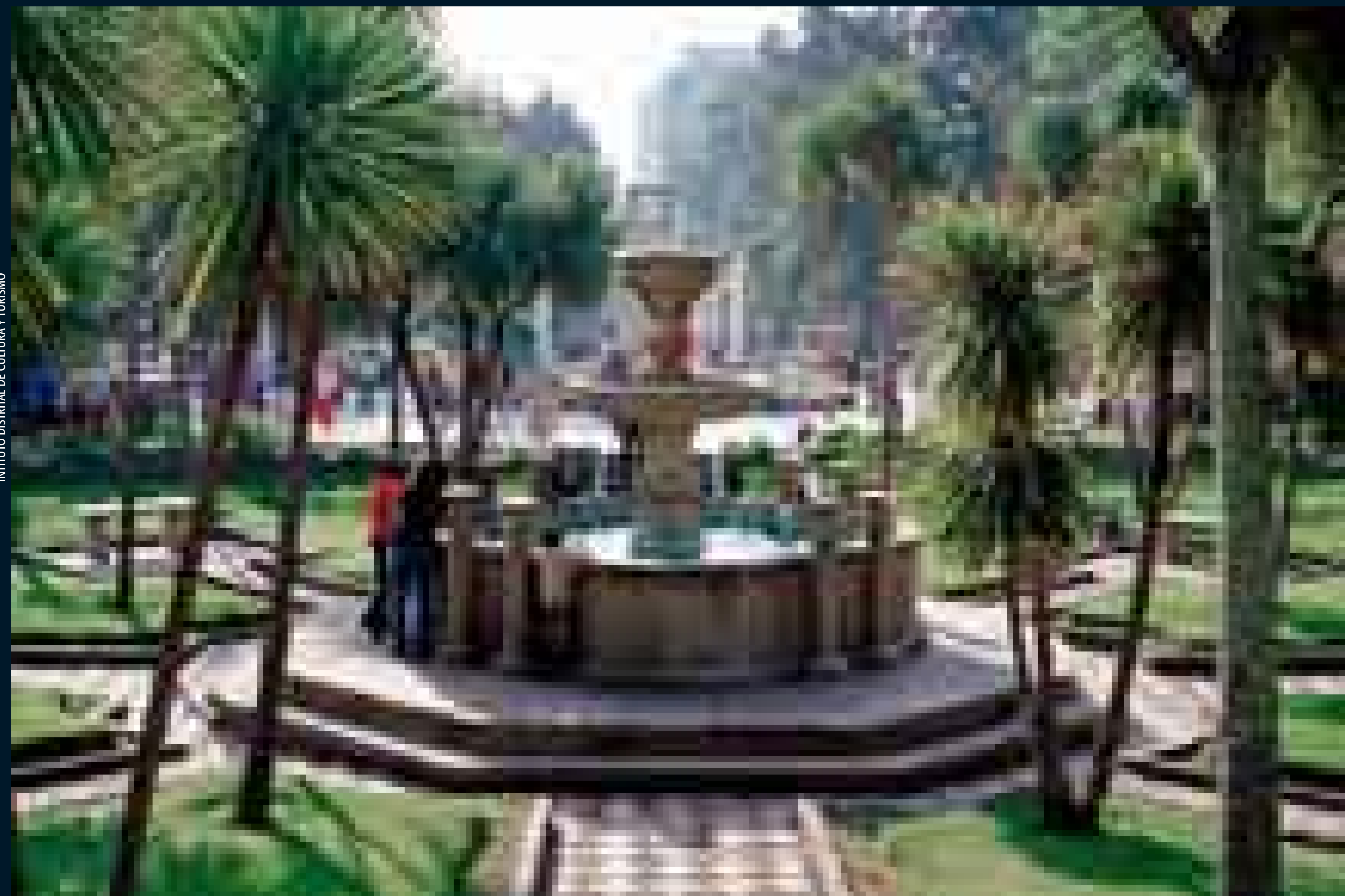
Parque Nacional "Olaya Herrera".