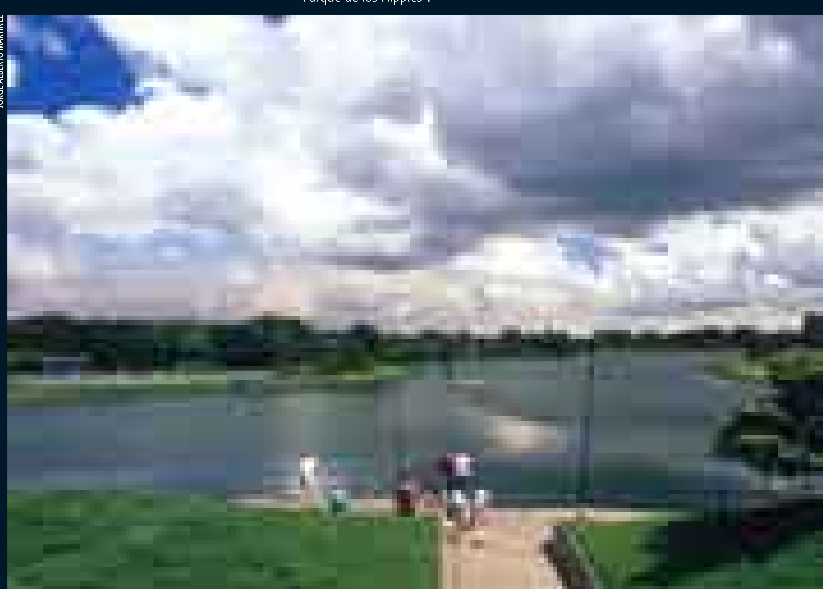
Parque Metropolitano Simón Bolívar.