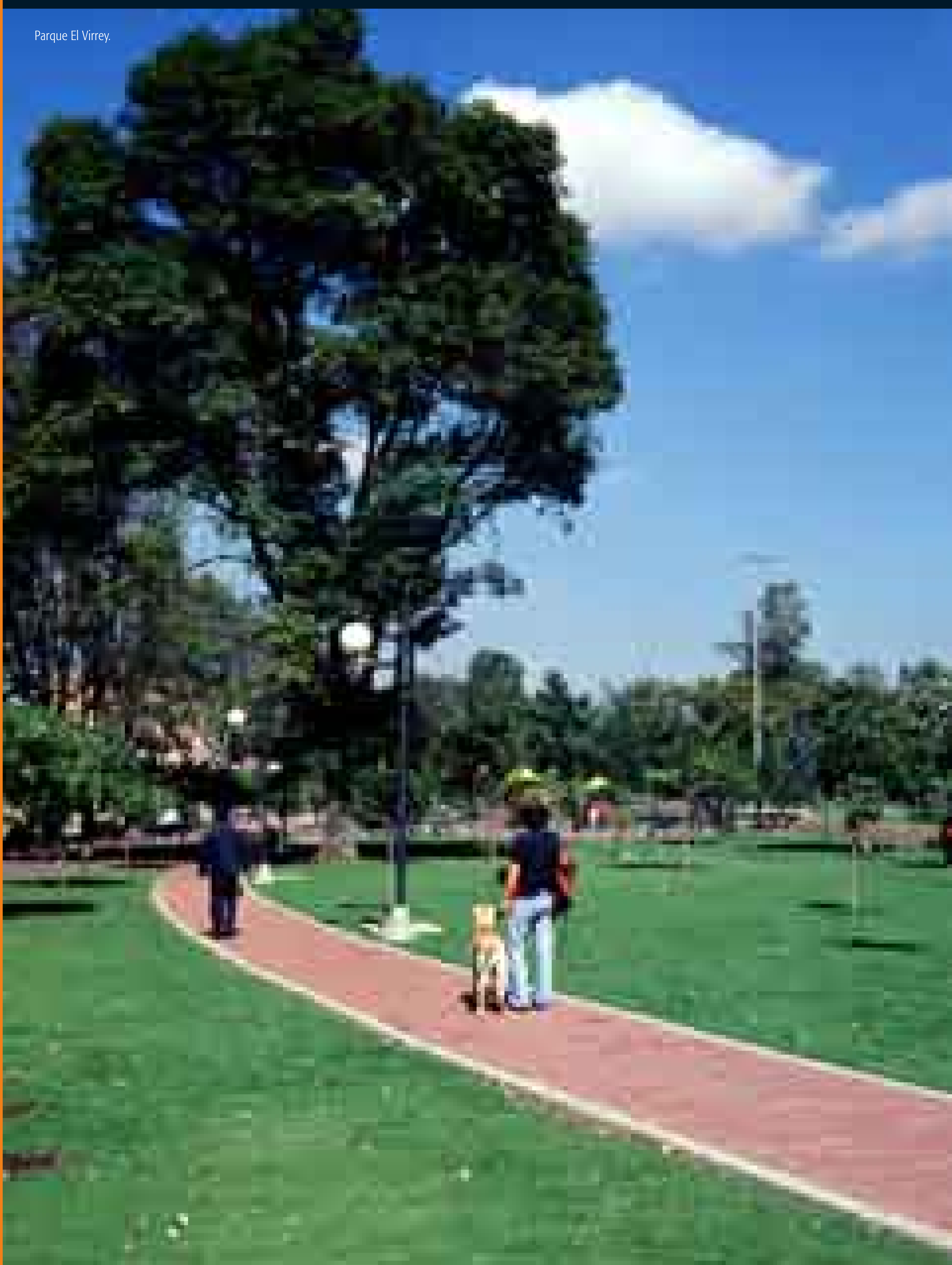
Parque El Virrey.