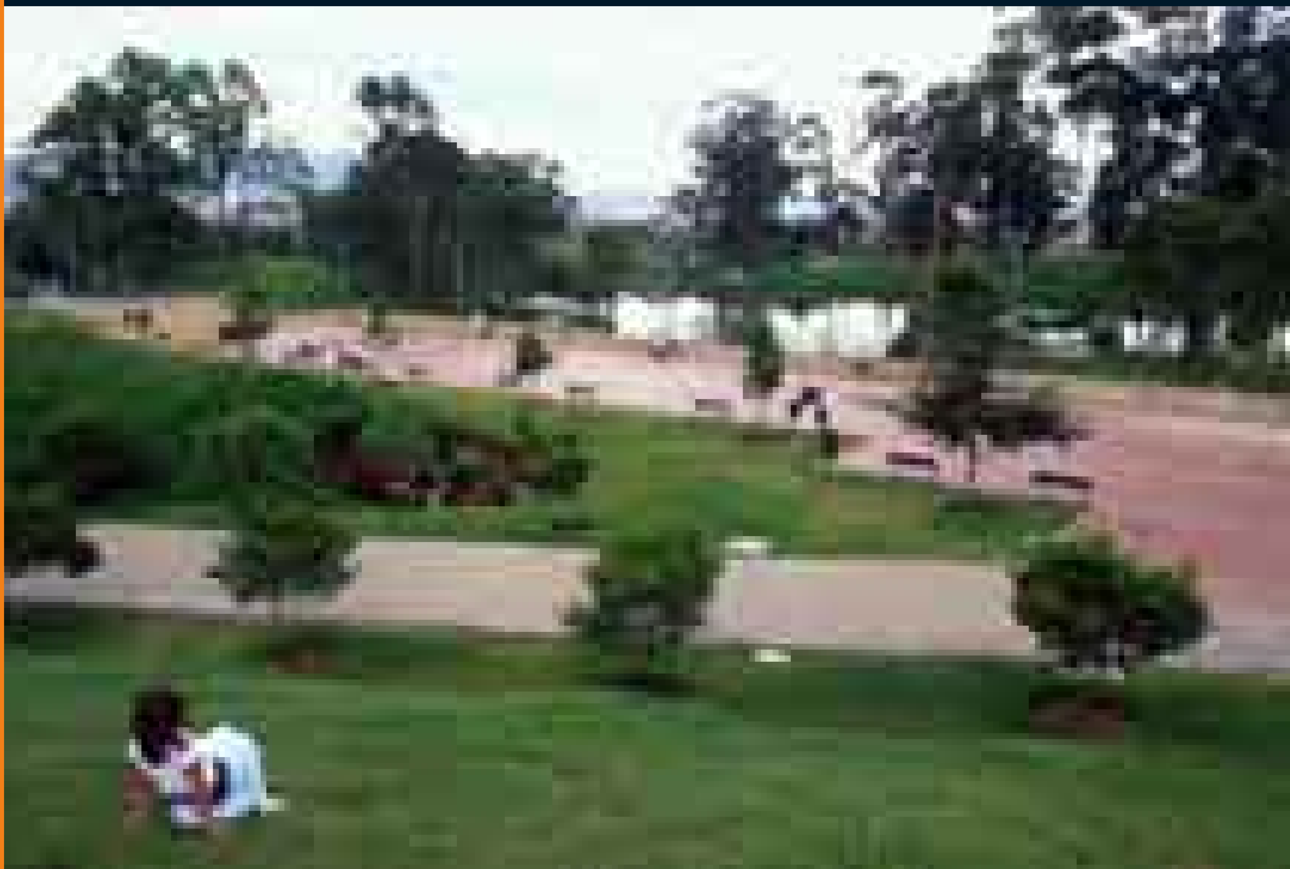
Parque Timiza al sur de la ciudad.