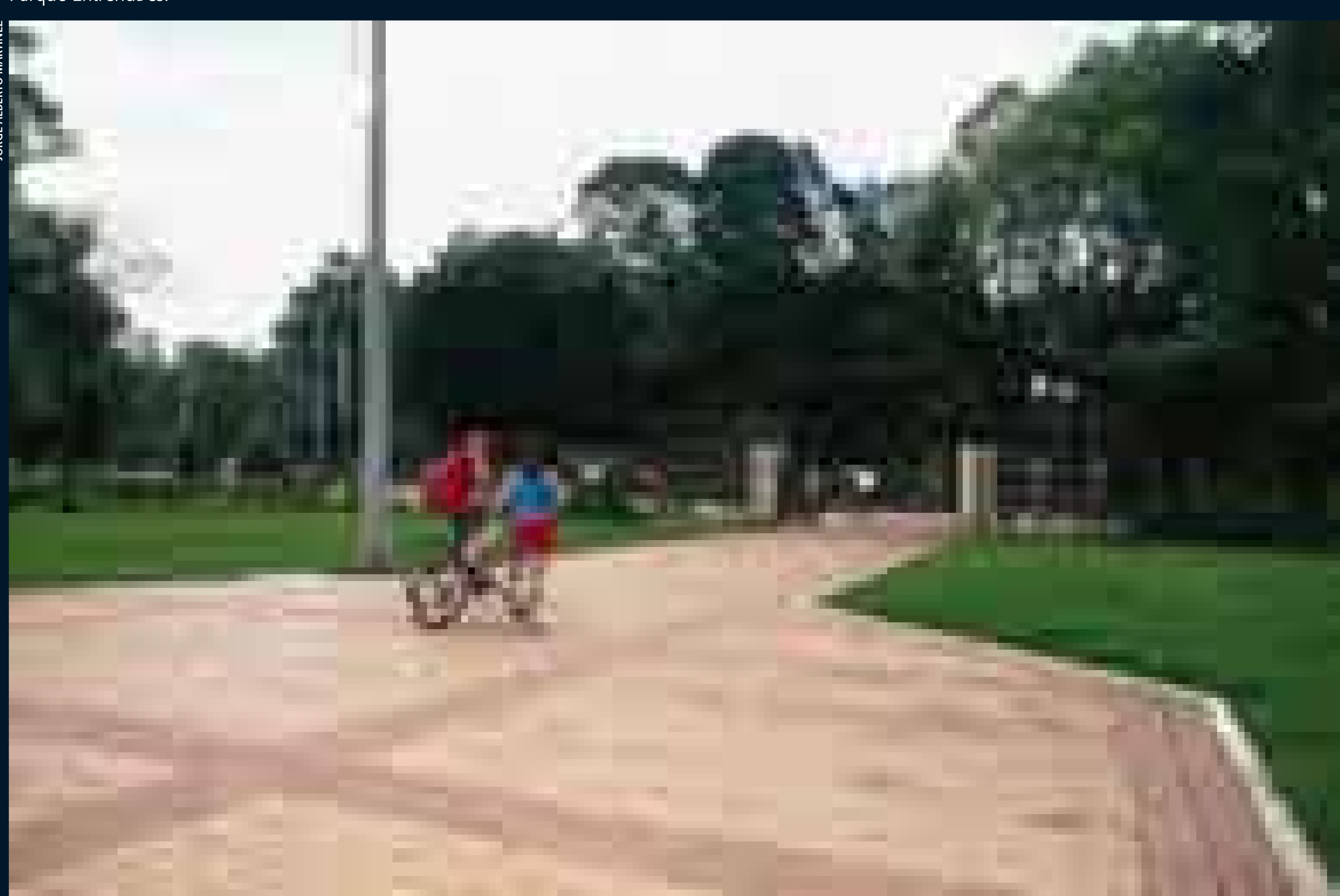
Parque La Florida.